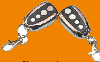
รีโมทคอนโทรล