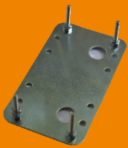
ฐานมอเตอร์