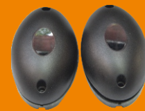
โฟโตเซลล์